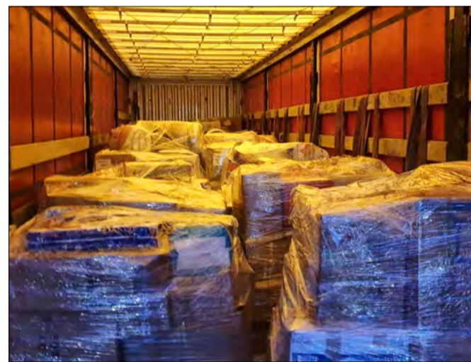
📷 Transport humanitarny na Ukrainę