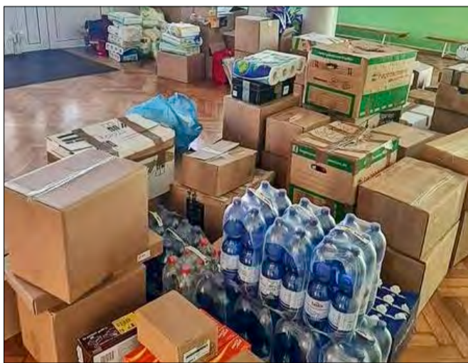
📷 Dary zbierane w SP nr 2 w Tuszynie