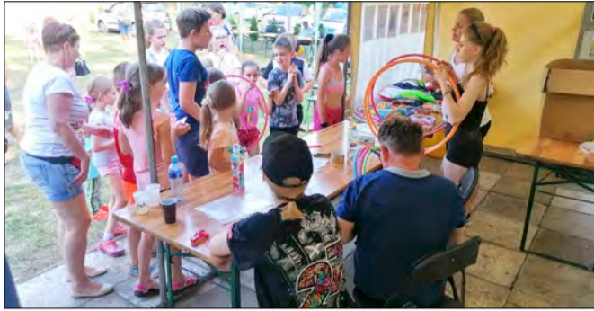
Piknik w Rydzynkach

tegrując wszystkich uczestników można było również pojeździć na quadzie i bryczką oraz ochłodzić się przy wodnych atrakcjach.