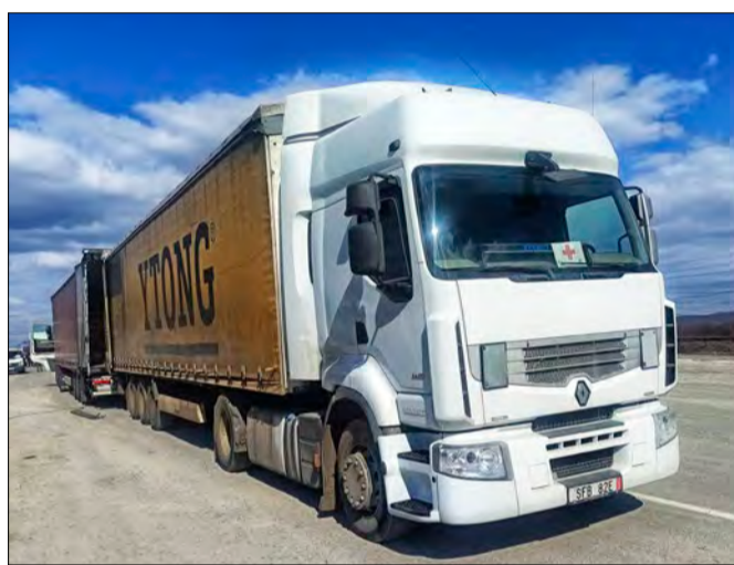
📷 Dary z Tuszyna w Halmeu na granicy Rumuńsko - Ukraińskiej

Fot.: Archiwum: Blenda Tuszyn, S.Kulida, A.Nestierenko (Bucza, Irpień, Borodzianka)