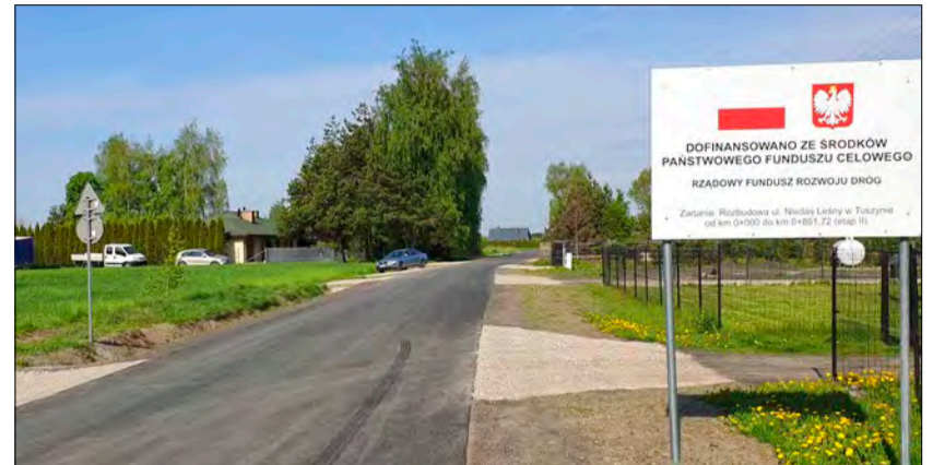
ul. Nidas Leśny