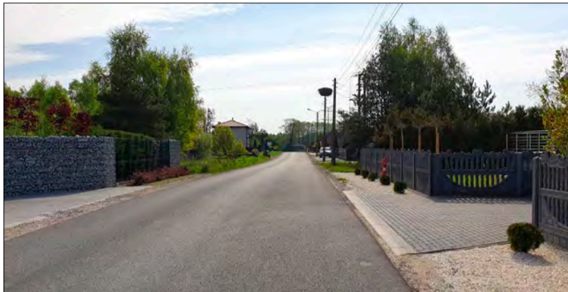
Droga w Modlicy

Rozbudowa miała na celu poprawę istniejącego systemu komunikacyjnego na terenie gminy Tuszyn i obejmowała prace na odcinku publicznej drogi gminnej nr 106835E ul. Nidas Leśny o długości 508,81 m. Wcześniej droga na projektowanym odcinku miała nawierzchnię gruntową, której stan był zły. Droga nie posiadała rowów a pas drogowy porośnięty był licznymi drzewami i krzakami, które utrudniały przejazd. Rozbudowa polegała na położeniu warstwy scieralnej z betonu asfaltowego o grubości 4 cm, warstwy wiążącej z betonu asfaltowego o grubości 4 cm, wykonaniu podbudowy pomocniczej z tłuczni kamiennej o grubości 20