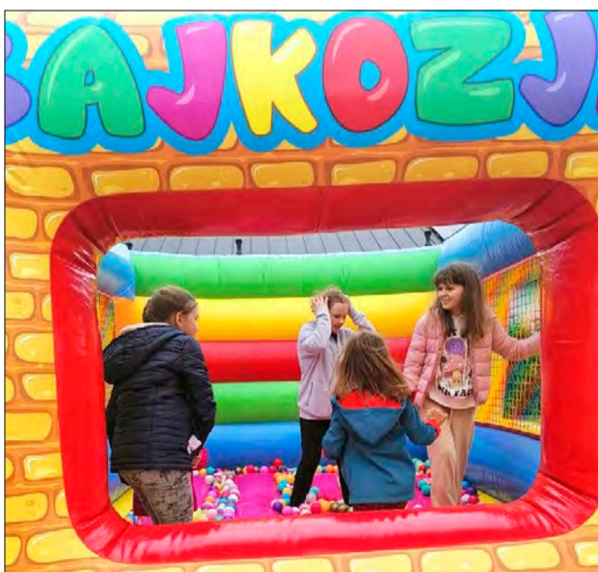
Piknik w Dylewie

cm, warstwy mrozoochronnej z piasku o grubości 12 cm. W projekcie przyjęto szerokość jezdni 5 m i pobocza 0,75 m. W projekcie przewidziano także zjazdy o nawierzchni z tłuczni o grubości 15 cm na 10-centymetrowej podsypce z piasku. Inwestycja realizowana była przez Przedsiębiorstwo Budowy Dróg i Mostów ERBEDIM Sp z o.o. z Piotrkowa Trybunalskiego, na podstawie umowy z Gminą Tuszyn na kwotę 623 242,03 zł brutto, w związku udzielonym dofinansowaniem z Rządowego Funduszu Rozwoju Dróg.